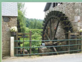
Moulin à eau du Pont Loyer