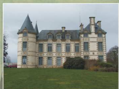
Château de Beaubois