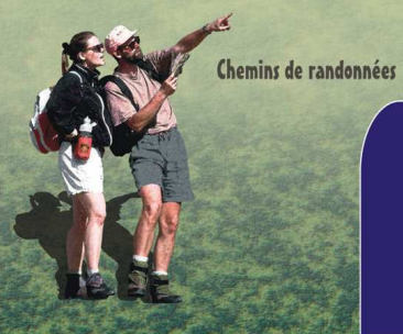
Chemins de randonnées