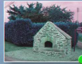
Four à pain communal