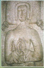
Dalle tumulaire (XV e ème)

1 L'église Saint-Pierre achève en 1893 comporte une très belle croix baptismale du XV e siècle et une dalle tumulaire d'une dame de Plorec, ainsi que les deux croix près de l'église (XVII e ) et la statue en bois polychrome de Saint-Roch datant du XVI e siècle.