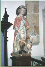
Statue de St-Roch (XVI e ème)

2 La vallée de l'Arguenon fait de Plorec sur Arguenon un haut lieu de villégiature pour les passionnés de randonnée, de pêche et de tourisme vert. De nombreux circuits de randonnées y ont été aménagés le long du lac de la Ville Hatte permettant de découvrir des paysages variés. Le barrage de la Ville Hatte, inauguré en 1973 par Pierre Messmer sert de retenue d'eau, environ 12 millions de m 3 . Il mesure 17 Km de long et alimente une cinquantaine de châteaux d'eau de nombreuses communes de la région.