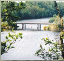
Plan d'eau de l'Arguenon

3 Plan d'eau de l'Arguenon. Pont reliant les communes de Plorec sur Arguenon et Pléven. (RD 68)