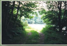
Sentier piétonnier et plan d'eau

5 Le sentier piétonnier sur la rive gauche du plan d'eau (côté Plorec) ombragé et calme, bien que dangereux à certaines périodes, incite à la promenade pour admirer la nature, la faune aquatique et sauvage.