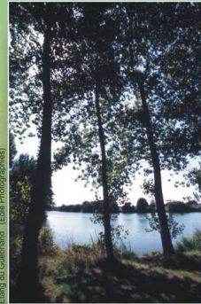
Etang du Guébriand (Ecole Photographique)

7 Etang du Guébriand (superficie de 11 Ha). Racheté par la commune en 1984, l'étang offre un circuit de promenade le long de ses berges. Lieu privilégié pour pique-niquer, de nombreuses associations profitent de son aménagement (tables et bancs couverts, commodités, électricité) pour y organiser leurs manifestations.