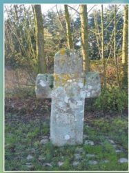
Croix de la Ville Echot

5 Le Pont Loyer. Moulin à eau situé en limite de Pluduno et Boursenl.