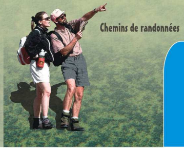
Chemins de randonnées