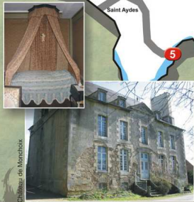
Château de Monchoix

4 Château de Monchoix. Bâti en 1759 par le Comte Antoine de Bède (oncle maternel de Châteaubriand) pour remplacer la Mettrie-Martin, (XV ème ). La même famille y habite depuis presque quatre siècles. Le souvenir de Châteaubriand y reste vivant, sa chambre ayant été conservée intacte. Possibilité de visites (se renseigner à l'Office de Tourisme).