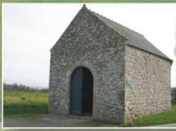
Chapelle Saint-Roch (XIX ème )