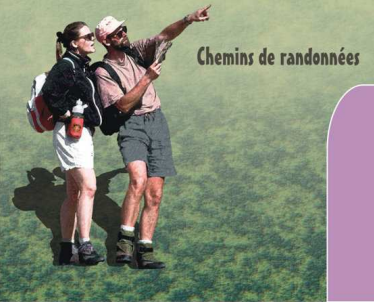
Chemins de randonnées

Créhen La douceur de la campagne au bord de la mer